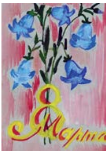
Рисунок Эмилии Джантемировой, 5 «Б»