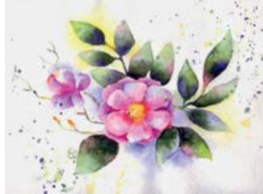
Рисунок Эмилии Джантемировой, 5 «Б»