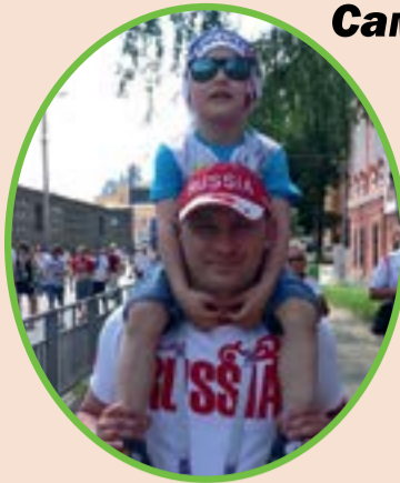
Самые активные папы в 1 «Б»