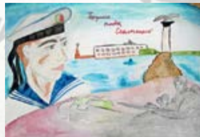
Город-герой Севастополь. Рисунок Тимофея Пунгина, 1 «Б»

Запах сена на повети и студёная вода. Это счастье жить на свете мирно долгие года. Сила армии России – это русская земля! Слава армии России! С двадцать третьим февраля!