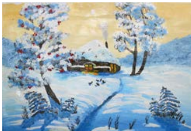
Рисунок Алены Кассиной, 1 «Б»