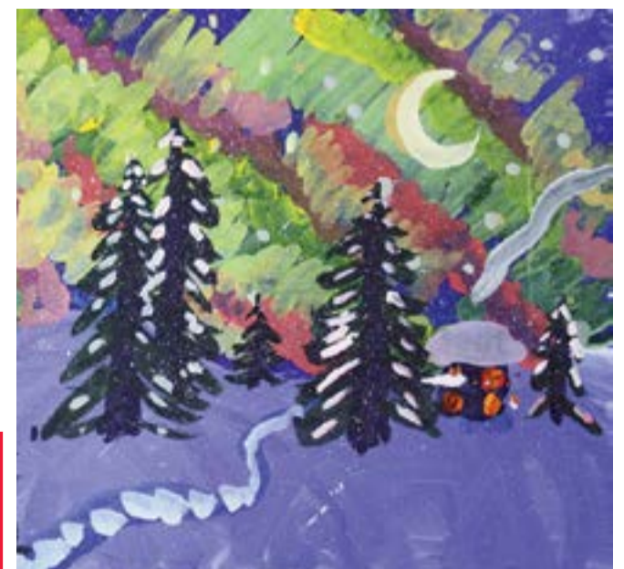
Рисунок «В зимнем лесу» Никиты Веснина, 1 «А»

Они первыми справились с викториной газеты (см. №3 (177) от 07.11.2019).