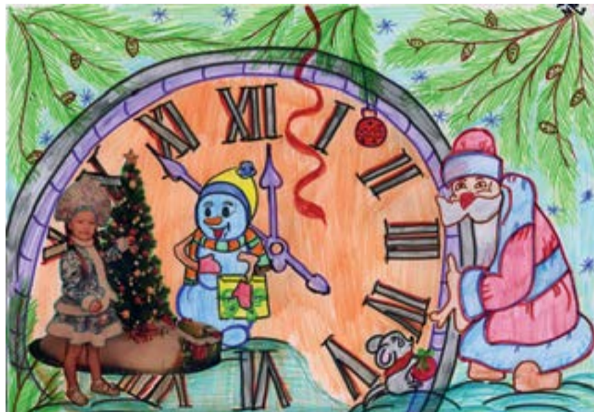
Рисунок Дарьи Скурихиной, 1 «Б»