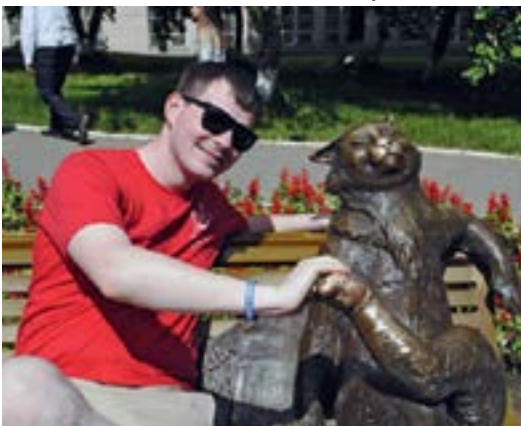
Д. В. Медведев