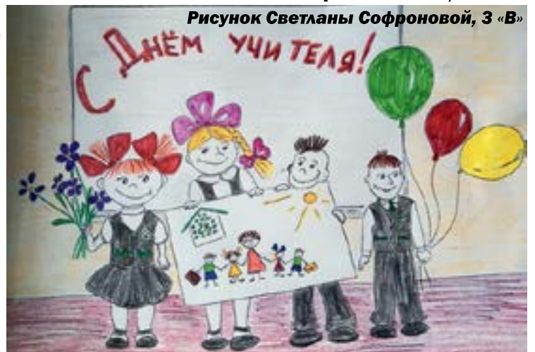
Рисунок Светланы Софроновой, 3 «В»