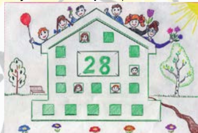
Рисунок Анны Писаревой, 2 «Б»