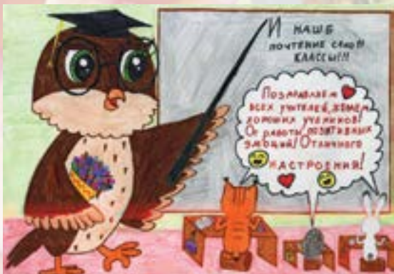
Рисунок Наталии Жениховой, 4 «А»