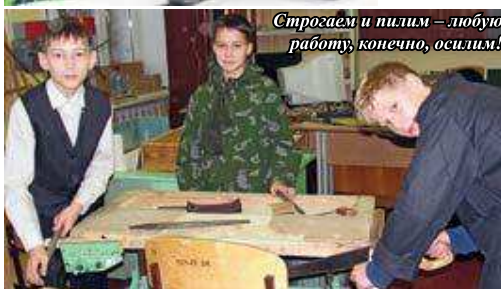
Строгаем и пилим – любую работу, конечно, осилим!