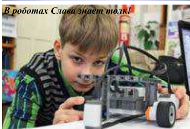
В работах Славы знает толк!