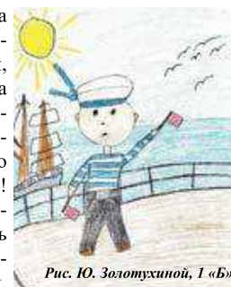
Рис. Ю. Золотухиной, 1 «Б»

Любит рыбалку – он специалист в этом деле! Еще папа увлекается боксом и поэтому может дать отпор каждому! Это не мешает ему печь вкусные торты и хрустящее печенье.