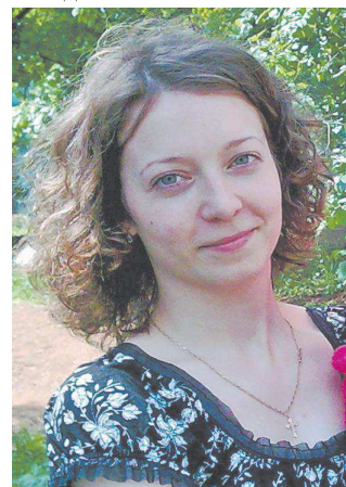
Беседа записала Мария Конышева, 7«Б»

– Ответственность за порученное дело и исполнительность, которые, несомненно, помогают мне как в жизни, так и в профессиональной деятельности.